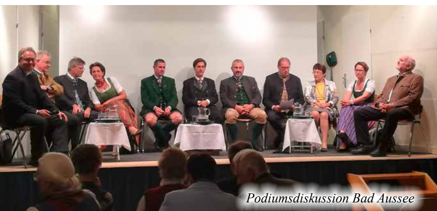
Podiumsdiskussion Bad Aussee