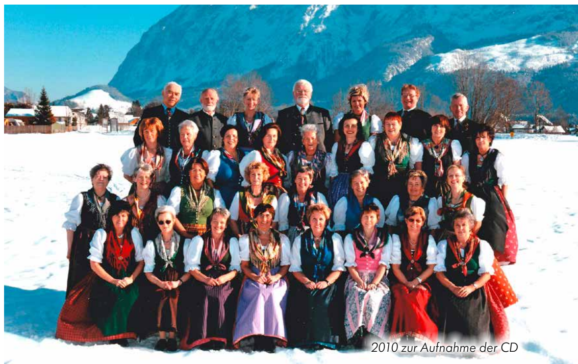
2010 zur Aufnahme der CD