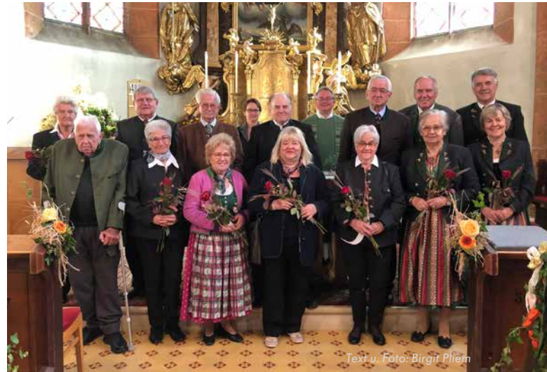
Text u. Foto: Birgit Plien

gratulierte Pfarrer Unger jedem Jubelpaar und überreichte symbolisch jeder Ehefrau eine rote Rose. Die Liebe zwischen zwei Menschen lebt von den schönen Augenblicken. Aber sie wächst durch die schwierigen Zeiten, die beide gemeinsam bewältigen. In diesem Sinne wünschen wir allen Ehepaaren noch einmal alles Gute und Gottes Segen.