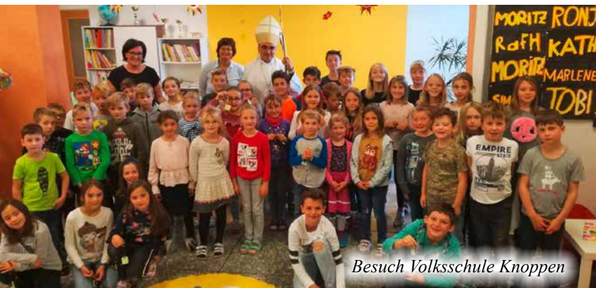
Besuch Volksschule Knoppen