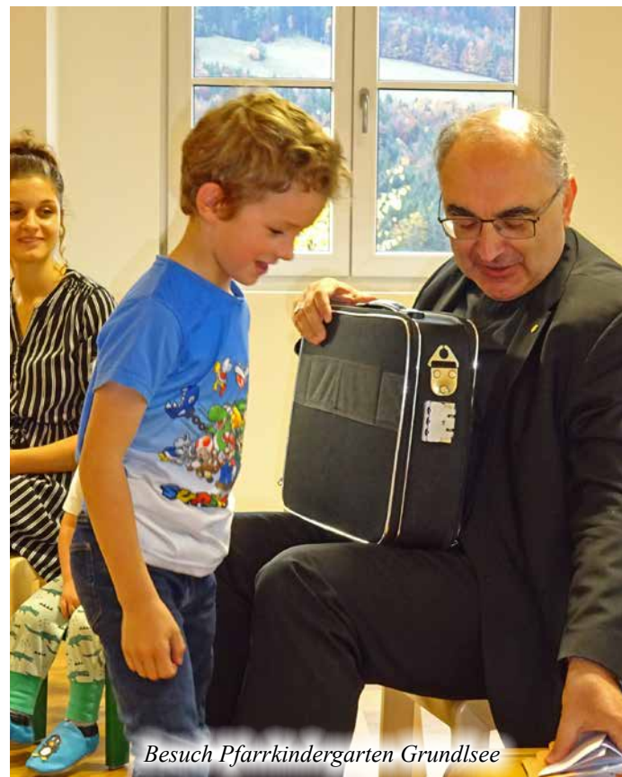
Besuch Pfarrkindergarten Grundlsee